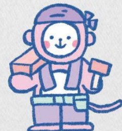
ハッピーモンキー(大工)