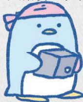
ペンペン(ブロック工事)