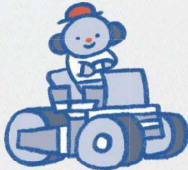
コア・ラ(舗装工事業)