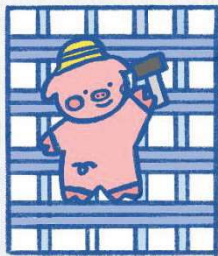
とんととん(型枠大工)